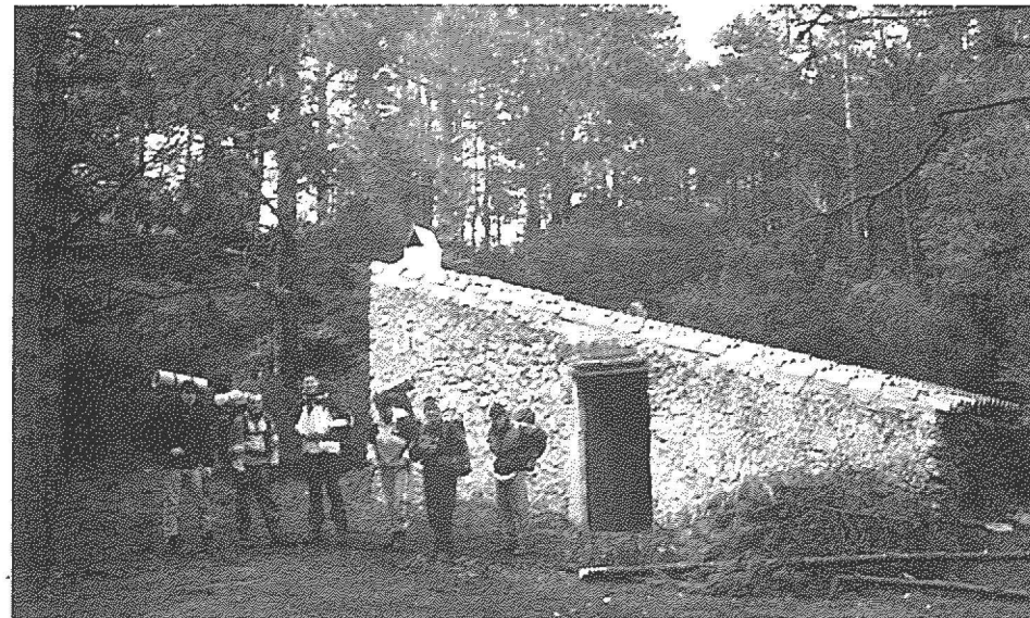
Refugi de Clotes (UEC)